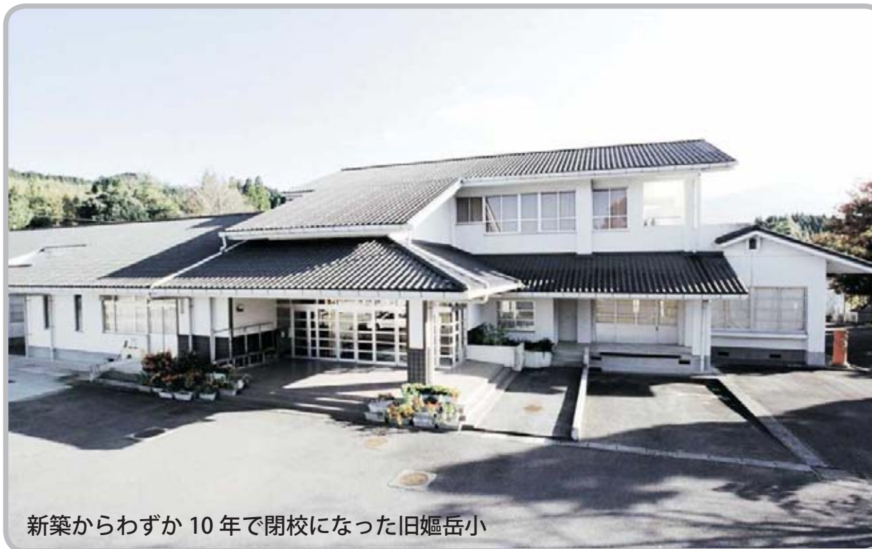
新築からわずか10年で閉校になった旧姫岳小

会の子どもに農林業や自然体験をさせる場のできないかと考えている。「もともと学校だった場所で農林業の良さや、田舎でしか得られない心の豊かさを、都会の子どもたちに教えたい。すぐには結び付かないだろうが、将来はきっと、