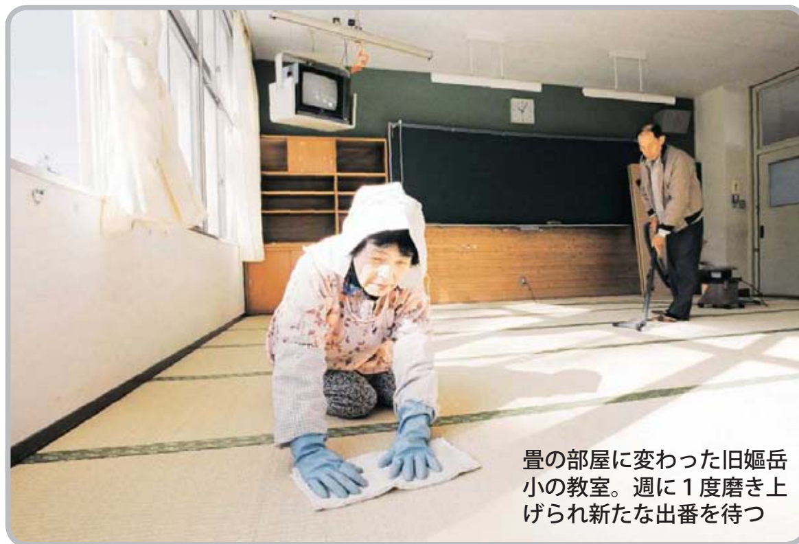
畳の部屋に変わった旧嶮岳小の教室。週に1度磨き上げられ新たな出番を待つ