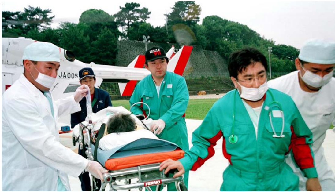
「ドクターヘリ」で久留米大学病院の高度救命救急センターに搬送される患者＝久留米大学病院

県内へのドクターヘリ出動は二〇〇二年度十四件、〇三年度三十四件。いずれも命を救うことへとつながったのだが、実は、今年六月以降は県内に飛来しなくなった。「久留米大のドクターヘリを活用する予定はない。救急車で対応できない場合は県央空港（大野町）の県防災ヘリを使う」と県医務薬事課。